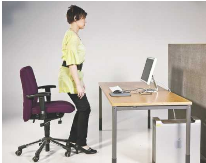
Nouse näin: Mieti, että päästäsi vetää naru ylöspäin. Nouse tuolilta kevyesti kädet rentoina. Oppi perustuu Alexander-tekniikkaan.