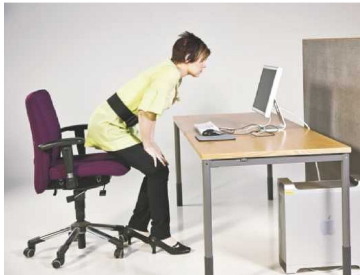
Ei näin: Käytät liikaa lihasvoimaa, kun pusket käsillä itsesi ylös.

kipuja koskaan, mutta useimmat alkavat kärsiä tuki- ja liikuntaelinvaivoista laiminlyötyään työergonomian.